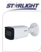
IPC- FHW2241T-ZS € 380,00