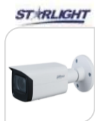
IPC- FHW3241T-ZAS € 476,00