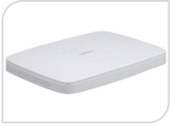
IP- NVR4116-8P-4KS2/L € 490,00