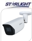
IPC- HFW3841E-SA € 450,00