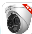
TPC-DF1241-B7F8-DW-S8 € 1.620,00