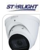
IPC- HDW5842T-ZE-S3 € 835,00

8MP * CMOS progressivo 1/2.5" STARVIS * Ottica Motorizzata 2.7~12mm * 2 IR LED 50m * MICROFONO * H265/H264 * IP67 * IK10 15fps@4K * IVS : Tripwire * Intrusion * Oggetto Abbandonato/Dimenticato * Analisi Video * Face Detection * ICR auto * f1.5 auto IRIS(DC) * luminosità 0.05Lux f1.4(0 Led ON) * 1 LAN 10/100Mbps * 1 Slot MicroSD 128Gb * 4 aree Privacy Mask * 3D * WDR (120db) * Alimentazione 12Vdc AC24Vo ePoE <8.5W ACCESSORI OPZIONALI: PFB137 * PFB203W * PFA152-E *DIMENSIONI: Φ122mmx104mm *PESO: kg.0.6