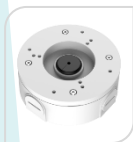
SE-PFA5300R € 50,00

WATER-PROOF BOX DI GIUNZIONE - MATERIALE: IN ALLUMINIO & SECC – BIANCO DIMENSIONI: 11.6 mm × 36.0 mm PESO: Kg 0,33 CARICO: 2 Kg TEMPERATURA -40°C +60°C UMIDITA': <90% RH