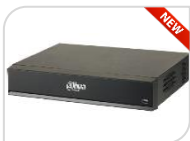
IP- NVR5216-16P-I/L € 2.660,00