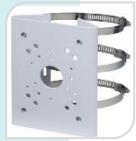
SE-PFA150 € 76,00

STAFFA DA PALO MATERIALE: ALLUMINIO DIMENSIONI: 125,6x114x20 DIAMETRO: 80-150mm TEMPERATURA: <40°C+60°C UMIDITA': <90% RH PESO: Kg 0,27 CARICO: Kg 3