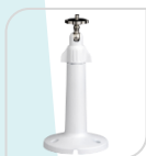
SE-PFB110W € 18,00

STAFFA PER MONTAGGIO A PARETE IN ALLUMINIO - BIANCO DIMENSIONI: 235.4 mm x 180.3 mm x 84.2 mm PESO: kg 0,97 CARICO: Kg 3 TEMPERATURA -40°C to +60°C UMIDITA' 0~90%RH