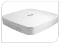
IP- NVR2104-I2 € 220,00