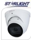
IPC- HDW2241T-ZS € 350,00

2.0 Mp Sensore CMOS progressivo 1/2.8" * Ottica Motorizzata 2.7~13.5mm * STARLIGHT * H265/H264 * Analisi Video * Tripwire * Intrusion * ICR auto * f1.5 auto IRIS(DC) * Luminosità 0.002Lux f1.5 (0 con Led ON) * 2 LED IR fino a 40m * 1 LAN 10/100Mbps * 1 slot microSD-Card per brevi backup 256Gb * Privacy Mask 4 aree * 3D* WDR (120db) * esterno/interno IP67 * Alimentazione 12Vdc o PoE <6.4W ACCESSORI OPZIONALI : PFA130E – PFA152E- PFB203W *DIMENSIONI: 108.3 mm × Φ 122 mm * PESO: kg.0.69