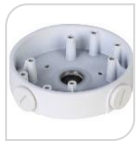
SE-PFA139 € 25,00

WATER-PROOF BOX DI GIUNZIONE – MATERIALE:IN ALLUMINIO - BIANCO DIMENSIONI: 161x38mm – PESO: kg 0.45 CARICO:3Kg TEMPERATURA -40°C +60°C UMIDITA' <90%RH