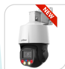
IPC- SD3E405DB-GNY-A-PV1 € 625,00