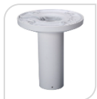
SE-PFB300C € 42,00

STAFFA PER MONTAGGIO A SOFFITTO IN ALLUMINIO BIANCO DIMENSIONI: Ø128.8mmx767.0mm PESO: 0,9 Kg CARICO: 2Kg TEMPERATURA -40°C +60°C UMIDITA' <90%RH