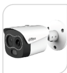
TPC-BF1241P-B3F4-DW-S2 € 1.610,00