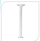
SE-PFB220C € 92,00