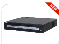
IP- NVR608H-64-XI € 4.690,00