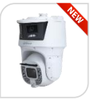
IPC-SDT8C842-8P-FA-APV € 7.100,00