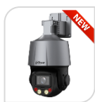
IPC- SD3C405DB-GNY-A-PV € 535,00