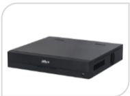
IP- NVR5216-16P-EI € 1.438,00