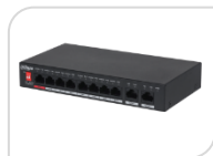
CS4010-8ET-110 NON DISPONIBILE

Switch desktop gestito su cloud a 6 porte con 4 porte PoE Port 1-8: 8 x RJ-45 10/100 Mbps (PoE); Port 9-10: 2 x RJ-45 10/100/1000 Mbps (uplink) virtual Lan (VLAN) DC 54V 1.22A Porta 1 ≤ 90 W, Porte 2-8 ≤ 30 W, total ≤ 110 W, max distanza 250mt *DIMENSIONI: 130 mm x 90 mm x 26 mm *PESO: 0.28 kg