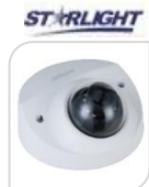
IPC- HDBW2231F-AS-S2 € 250,00