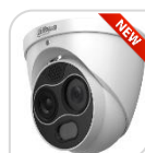
TPC-DF1241-B3F4-DW-S8 € 1.620,00