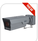
ITC431-RW1F-IRL8-C2 € 2.620,00

4Mp * Sensore di immagine CMOS ad alte prestazioni e processore che supporta l'estrazione continua dei metadati 24/7 * Lente varifocale motorizzata 8-32mm * Riconoscimento accurato di veicoli senza targa e modello del veicolo, logo del veicolo, serie del veicolo, colore del veicolo fino a 120km/h * IVS Rilevamento di intrusioni, rilevamento di vagabondaggi, fino a 4 aree * 2 in/2out allarme * 1in/1out audio * AUDIO BIDIREZIONALE * 4 IR LED max fino a 30m * grado di protezione IP67 * alimentazione 12V - ACCESSORI OPZIONALI: PFA150 *DIMENSIONI: 96.0 mm x 120.8 mm x 127.8 mm * PESO: Kg 2,3