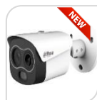
TPC-BF1241B3F4-DW-WIFI-S8 € 1.710,00