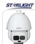
IPC- SD6AL445XA-HNR-IR € 3.060,00