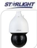
IPC-SD5A825GA-HNR NON DISPONIBILE

8Mp * 40X ZOOM * 1/1.8" STARVIS CMOS * AUTOTRACKING * Ottica Varifocale 5.6mm-223 mm * IVS : (Tripwire, Intrusion, Abandoned/Missing) * Face Detection * Heat Map * 10 LED 450m * STARLIGHT 0.002Lux@F1.4 * TERGICRISTALLO INTELLIGENTE * H.265+ / H.265 / H.264+ / H.264 * risoluzione max 25 fps@ 4K WDR 120dB - Day&Night (ICR) * Ultra-DNR * Autoliris e AutoFocus * AWB * HLC * BLC * PFA * 7in/2out Allarme * 1in/1uscita audio - Alimentatore AC24V/3A HI-POE * IP67 ACCESSORI INCLUSI: PFB306W - ALIMENTATORE AC24V/3A ACCESSORI OPZIONALI: PFA120 * PFA140 * PFA150 * PFA151 *DIMENSIONI: φ262x415,6mm * PESO: Kg 8,5