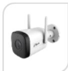
IPC- HFW1430DT-STW € 220,00