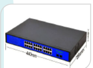
G2422GB € 840,00