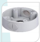
SE-PFA13C € 25,00

WATER-PROOF BOX DI GIUNZIONE – MATERIALE:IN ALLUMINIO - BIANCO DIMENSIONI: 96,8x37,2mm – PESO: kg 0.17 CARICO:1Kg TEMPERATURA -40°C +60°C UMIDITA' <90%RH