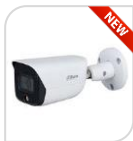
IPC- HFW3549E-AS-LED € 389,00