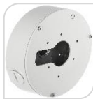
SE-PFA13F € 64,00

WATER-PROOF BOX DI GIUNZIONE – MATERIALE: IN ALLUMINIO & SECC - BIANCO DIMENSIONI: 138x42mm – PESO: kg 0.38 CARICO: 3Kg TEMPERATURA -40°C +60°C UMIDITA': <90% RH