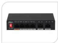
CS4006-4ET-60 NON DISPONIBILE