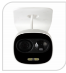
IPC- HFW1831C-PIR € 360,00