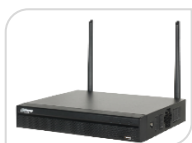
IP- NVR1108HS-W-S2 € 266,00

NVR 4 CH WI-FI * 4-ch@1080P (25FPS) * Nuova interfaccia utente 4.0 * Supporta telecamere mainstream di protocollo ONVIF * Smart H.265/Smart H.264 * Uscita video simultanea VGA/HDMI, risoluzione massima di HDMI è 1080P * Configurazione e gestione remota di IP, come ad esempio l'impostazione parametri * DHCP (Dynamic Host Configuration Protocol), HTTP (Hypertext Transfer Protocol), NTP (Network Time Protocol) e DDNS (dinamico Domainname System) * DIMENSIONI: 260.3 mm × 247.3 mm × 44.7 mm * PESO: 0.824 kg