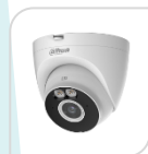
IPC- T4A-LED € 190,00

* DIMENSIONI: Ø109.9 mm x 102.2 mm * PESO: 352g