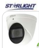
IPC- HDW5831RP-ZE € 689,00