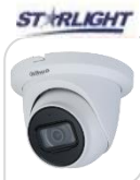
IPC- HDW5842TM-ASE-S3 € 650,00

8MP * Eco-Savvy * Sensore d'immagine 1/2.3" 4K progressive scan CMOS * Ottica 4,0mm * Illuminatore IR max 30m * ULTRA HD 4K (3840x2160) * Max 15fps@4K(3840x2160) * Day/Night (ICR) * 3DNR * AWB * AGC * BLC * Protezione IP66 * IK10 * CMS per PC/Mac (PSS/DSS) * App per iPhone e Android (iDMSS) * Alimentazione 12V DC/PoE IEEE802.3af < 7.5W ACCESSORI OPZIONALI: PFA131 PFA123 PFB200W *DIMENSIONI: 110mmx81mm *PESO: Kg 0.406