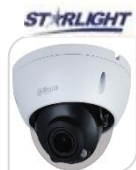
IPC- HDBW2831RP-ZS-S2 € 480,00