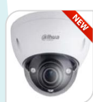
IPC- HDBW5842E-ZE-S3 € 870,00

8MP * CMOS progressivo 1/2.5" * Ottica Motorizzata 7-35mm * 5X ZOOM * luminosità 0.05Lux f1.4 (0 con Led Smart ON) * 3 LED IR 100m * H.265 codec * 15fps@4K * IVS : Tripwire * Intrusion * Oggetto Abbandonato/Dimenticato * Analisi video * Face Detection * ICR auto * f1.5 auto IRIS(DC) * 1 LAN 10/100Mbps * 1 in/1 out Allarme * 1 in/1uscita audio * Slot Micro SD * 4 aree Privacy mask * 3D * WDR (120db) * IK10 * IP67 * D/N * Alim. 12Vdc AC24Vo ePoE <15W * ECO-savvy ACCESSORI OPZIONALI:PFA138 * PFB302S* PFA101 * PFB300C * PFA152-E* PFB201C* PFB302S *DIMENSIONI: Φ159.1mmx117.9mm *PESO: kg.0.95