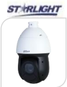
IPC- SD49225DB-HNY € 1.140,00

2Mp * Sensore 1/2.8" SONY STARVIS CMOS * Ottica Motorizzata 2.7-11 mm * Triplo stream * 4X STARLIGHT 0.005Lux@F1.6 * MICROFONO * 2 IR 30m * 25/30fps@1080P*True WDR (120dB) * Codifica video ad alta efficienza H.265 * IVS : Tripwire. Intrusion, Abandoned/missing * Motion Detection * 24 area Privacy Masking * Compatibile con ambienti a temperature estreme da -30°C a +60°C con 90% di umidità * D/N * ULTRA DNR * Alimentazione 12V1.5 A / PoE - Consumo 10W, 13W(IR ON) * METALLO ACCESSORI OPZIONALI: PFB302S * PFA103 * PFA150 * PFB300C PFA151 *DIMENSIONI : 132,7x117,9mm * PESO : kg 0,950