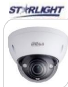
IPC- HDBW5231EP-ZE € 480,00