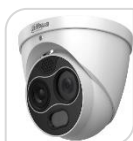
TPC-DF1241P-D3F4 € 1.590,00