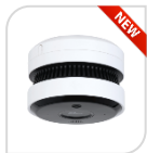
HY-SAV849HA-E € 385,00