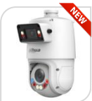
IPC-SDT4E425-4F-GB-A-PV1 € 1.620,00