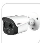
TPC-BF1241P-B10F12-DW-S2 € 1.680,00