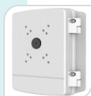
SE-PFA140 € 300,00

WATER-PROOF BOX DI GIUNZIONE – MATERIALE: IN ALLUMINIO - BIANCO DIMENSIONI: 115x160x37 mm PESO: kg 0.53 CARICO: 7Kg TEMPERATURA -40°C +60°C UMIDITA' <90%RH