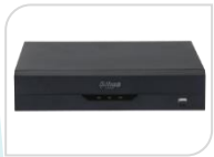
IP- NVR2104HS-P-I2 NON DISPONIBILE