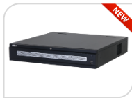
IP- NVR608H-32-XI € 3.720,00