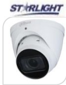
IPC- HDW2231T-ZS-S2 € 285,00