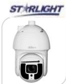
IPC-SD8A840VI-HNI € 4.950,00