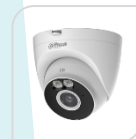
IPC- T4A-PV NON DISPONIBILE

* DIMENSIONI: Ø109.9 mm x 102.2 mm * PESO: 353 g