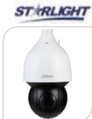
IPC- SD5A225GB-HNR € 1.670,00