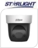
IPC- SD29204UE-GN € 640,00