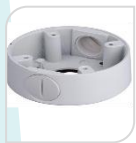
SE-PFA13A-E € 25,00

BOX DI GIUNZIONE A PARETE RESISTENTE ALL'ACQUA MATERIALE:IN PLASTICA RESISTENTE AGLI AGENTI ATMOSFERICI- BIANCO DIMENSIONI: 210,9x97,5x35mm PESO: kg 0.10 CARICO: Kg 0.300 TEMPERATURA -40°C +60°C UMIDITA' <90%RH