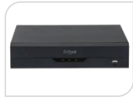
IP- NVR2104HS-I2 NON DISPONIBILE