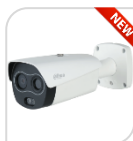
TPC-BF2241P-TB3F4-DW-S2 € 2.390,00