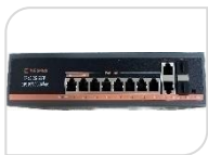
G0821GB-C € 292,00