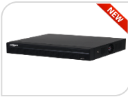
IP- NVR4216-4KS3 € 489,00