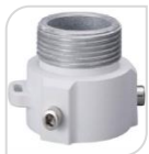
SE-PFA111 € 16,00

STAFFA PER MONTAGGIO A SOFFITTO IN ALLUMINIO & PC - BIANCO DIMENSIONI: 136,6x235,5mm PESO: kg 0.78 CARICO: Kg 7.0 TEMPERATURA -40°C +60°C UMIDITA' <90%RH