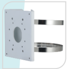
SE-PFA156 € 42,00

STAFFA DA ANGOLO MATERIALE: SECC BIANCO DIMENSIONI: 243x170x138mm TEMPERATURA: <40°C+60°C UMIDITA': <90%RH PESO: Kg 1.7 CARICO: Kg 10