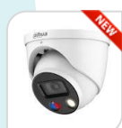
IPC-HDW3849H-AS-PV-S5 € 560,00