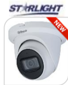
IPC- HDW2241TM-S € 248,00