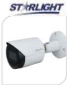
IPC- HFW2841S-S € 330,00

8Mp * 4K * Sensore CMOS progressivo 1/2.5" * Ottica 2,8mm * Zoom 16x * H265/H264 da esterno/interno * MICROFONO E ALTOPARLANTE (audio bidirezionale) IP66 * IVS : Tripwire, Intrusion * 15fps@8Mp (3840x2160) * WDR * D/N * 3DNR * AWB * AGC * BLC * ICR * Autoluminosità 0.002Lux f2 * 1 MAX IR LED fino a 20m * 2 IR luce bianca 10m * 1 LAN 10/100Mbps * 4 aree Privacy Mask * 1 Slot Micro SD per brevi backup 128Gb * 3D * D-WDR * Alimentazione 12V DC/ PoE * Consumo <3.8W * DIMENSIONI : 97.6x75.1x119 mm * PESO : kg.0.380