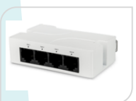
SE-AT13F € 31,20

Estensore Poe - Permette di ampliare la distanza di alimentazione Poe EXTENDER 4 PORTE POE 10/100Mbps