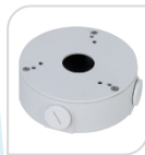
SE-PFA13G € 28,00

WATER-PROOF BOX DI GIUNZIONE - MATERIALE: IN ALLUMINIO & SECC – BIANCO DIMENSIONI: ø160mm x 41,5mm PESO: Kg 0,87 CARICO: 3 Kg TEMPERATURA -40°C +60°C UMIDITA': <90% RH