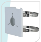
SE-PFA157 € 45,00

STAFFA DA PALO MATERIALE: ALLUMINIO DIMENSIONI: 140.0 mm × 130.4 mm × 45.0 mm TEMPERATURA: <40°C+60°C UMIDITA': <40°C+60°C PESO: 0.27 kg CARICO: 5 Kg