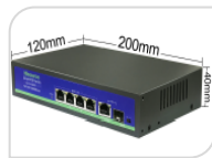
G0411GB € 208,00