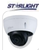
IPC- HDBW2241R-ZS € 330,00