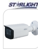
IPC- HFW5842T-ASE-S3 € 660,00