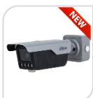
ITC413-PW4D-IZ1 € 1.240,00

4Mp * Sensore di immagine CMOS ad alte prestazioni e processore che supporta l'estrazione continua dei metadati 24/7 * Lente varifocale motorizzata 2,7mm – 12mm * Riconoscimento accurato di veicoli senza targa e modello del veicolo, logo del veicolo, serie del veicolo, colore del veicolo fino a 80km/h * IVS Rilevamento di intrusioni, rilevamento di vagabondaggi, fino a 4 aree * 2 in/2out allarme * 1in/1out audio * AUDIO BIDIREZIONALE * Doppia illuminazione : IR LED o luce bianca max fino a 10m * grado di protezione IP67 * alimentazione 12V ACCESSORI OPZIONALI: PFA150 *DIMENSIONI: 96.0 mm x 120.8 mm x 127.8 mm * PESO: Kg 2,3