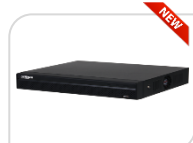
IP- NVR4104HS-4KS3 € 270,00