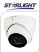
IPC- HDW3841EM-S-S2 € 470,00