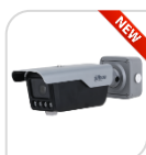
ITC413-PW4D-Z1 € 1.240,00

2,0 Mp * 1/2.8" Cmos * Lente varifocale motorizzata 3.2 mm – 10.5 mm * Riconoscimento accurato di veicoli senza targa e modello del veicolo, logo del veicolo, serie del veicolo, colore del veicolo fino a 30 km/h * 2 in/2out allarme * 1in/1out audio * SD card * Illuminatore a LED integrato 12m * grado di protezione IP67 * alimentazione 12v/24v * STAFFA INCLUSA *DIMENSIONI: 486.7 mm x 124.3 mm x 185.5 mm * PESO: Kg 1,9