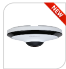
IPC- EW5541-AS (1.4mm) € 510,00