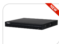
IP- NVR4208-4KS3 € 430,00