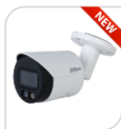
IPC- HFW2849S-S-IL € 340,00