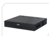
IP- NVR5208-EI € 770,00