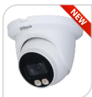
IPC- HDW3549TM-AS-LED € 352,00