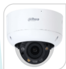
IPC-HDBW3549R1-ZAS-PV € 770,00