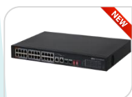
S4228-24GT-360 € 1.220,00

Switch di rete Dahua Layer 2 Managed/Gestito - S4220-16GT-240 20 porte: 16 Porte LAN PoE (10/100/1000M) + 2 porte LAN (No PoE 10/100/1000M) + 2 porte SFP ottiche 1000Mbps Capacità di switching 56Gbps - Packet Buffer Size 4.1Mbits - MAC Table Size 8K - Protezione dai fulmini fino a 4kV Supporta PoE / PoE+ e Hi-PoE (PoE++) Red Port 90W / Trasmissioni PoE a lunga distanza fino a 250m. *DIMENSIONI: 440 mm x 220 mm x 44 mm *PESO: 2,37Kg