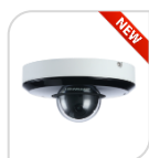
IPC- SD1A404XB-GNR € 578,00