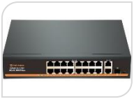
F1621GBL-C € 380,00