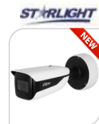
IPC- HFW71242H-Z-X € 1.800,00