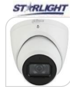
IPC- HDW5241TMP-ASE € 290,00

2.0 MegaPixel * EYEBALL IR camera * Sensore CMOS progressivo 1/2.8" * Ottica 2,8mm * STARLIGHT * Luminosità 0.007Lux f1.6 * AUDIO * H265/H264 * Analisi Video * Tripwire * intrusion * Object Abandoned /Missing * risoluzione 2Mp con 50Fp * ICR auto Face Detection * 8 LED IR fino a 50m * 1 LAN 10/100Mbps * 1 Slot micro SD-Card per brevi backup 128Gb * 3D * WDR 120db * esterno/interno IP67 alimentazione 12Vdc PoE <5.5W ACCESSORI OPZIONALI: PFA130-E * PFA139 * PFB204W * PFA 152-E *DIMENSIONI: Ø106x93.7 mm *PESO: kg.0.47