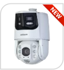
IPC-SDT6C432-4P-GB-APV € 2.485,00