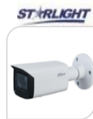
IPC- FHW3241T-ZS-S2 € 470,00