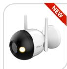
F4C-LED € 150,00

* DIMENSIONI: 180mm x 83.3mm x 114.8mm * PESO: 350.1 g