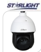
IPC- SD49425GB-HNR € 1.350,00