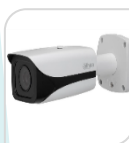
IP-SE- HFW81200 EP-Z € 1.450,00

12Mp * Ottica Motorizzata 4.1-16.4mm * ULTRA HD 4K (4000x3000) * Sensore d'immagine 1/1.7" 12 Megapixel progressive scan CMOS * Max 15fps@12M(4000x3000) 25/30fps@4MP(3840x2160) * Illuminatore IR 50m * Day/Night (ICR) * Ultra Defog * Smart Detection * ROI * CMS per PC/Mac (PSS/DSS) * App per iPhone e Android (iDMSS) * 2in/1out Allarme e 1in/1uscita audio * Slot per Micro SD 128GB * IP67 * Alimentazione 12Vdc o PoE IEEE802.3af < 24W con IR accesi ACCESSORI OPZIONALI: PFA121 PFA151 PFA152 *DIMENSIONI: 273x94.3x94.3mm *PESO: Kg0.800