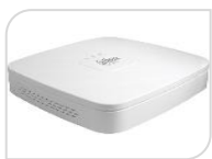
IP- NVR2108-I2 € 275,00