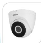
IPC- HDW1430DT-STW € 205,00