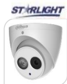
IPC- HDW4231EM-AS € 280,00