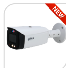
IPC-HFW3549T1-AS-PV-S4 € 550,00