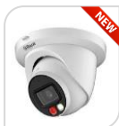
IPC- HDW2849TMP-S-IL € 340,00