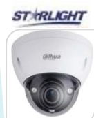
IPC- HDBW5831E-Z5E € 774,00