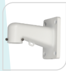
SE-PFB305W € 46,00

STAFFA PER MONTAGGIO A PARETE IN ALLUMINIO - BIANCO DIMENSIONI: 115x160x255mm PESO: kg 0.66 CARICO: Kg 7.0 TEMPERATURA -40°C +65°C UMIDITA' <90%RH