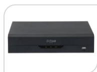
IP- NVR2108HS-I2 € 298,00