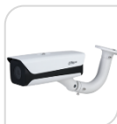
ITC215- PW6M-IRLZF-B € 1.480,00