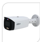
IPC-HFW3549T1-ZAS-PV € 770,00