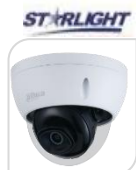
IPC- HDBW3241E-AS € 296,00