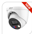
IPC-HDW3549H-AS-PV-S5 € 490,00