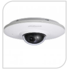
IP-SE HDB4200FP-PT € 380,00

MINI PT 2Mp * Full HD * 1/2.8" Sensore CMOS progressivo * Ottica fissa da 3.6mm * Digital Zoom 3X * MICROFONO * Risoluzione massima 2Mp con 25fps * Rotazione PAN 180° (0.1°~00°/s su preset) * TILT 0°~90° (0.1°~100°/s) * Luminosità 0.01lux f1.2 * Porta LAN 10/100Mbps * Privacy Mask 4 aree * 3D * D-WDR * Slot Micro SD-Card ( max64GB) * Eco Savvy * Alimentazione 12Vdc o PoE IEEE802.3af < 3W * CMS per PC/Mac (PSS/DSS) * App per iPhone e Android (iDMSS) * esterno/interno * IP66 * IK10 *DIMENSIONI: Ø130mmx57,5mm *PESO: Kg0.25