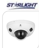
IPC- HDBW3241F-AS-S2 € 296,00

2.0Mp * 1/3" Sensore CMOS * alta definizione dell'immagine * Ottica Fissa 2.8mm * STARLIGHT * 0.005Lux@F1.6 * 8 Led IR integrato max 30m * MICROFONO INTEGRATO * Uscite max 4Mp(2688x1520) a 30fps * ROI * SMART H.264/H.265+ * Codifica flessibile * WDR * 3D DNR * BLC * Watermark digitale * Tripwire * Rilevamento del movimento * Manomissione del video * Rilevamento audio * Scheda SD piena o errore * 1 ing. 1 usc. Allarme * 1 ing. 1 usc. Audio * 4 Aree di Privacy Mask * Slot Micro 256 G * IP67 * IK10 * SMD PLUS * Alimentazione 12VDC/PoE * Metallo ACCESSORI: PFA139 – PFB204W *DIMENSIONI: 55 mm x Ø108.9 mm *PESO: 0.38 kg