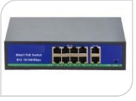
F0820FBL € 132,00