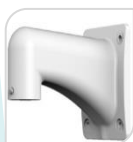
SE-PFB303W € 48,00

STAFFA PER MONTAGGIO A PARETE IP66 IN ALLUMINIO - BIANCO DIMENSIONI: 134x133,5x187,5mm PESO: kg 7 CARICO: Kg 4 PROTEZIONE IP66 TEMPERATURA -40°C +65°C UMIDITA' 0~90%RH