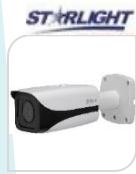
IPC- FHW5241E-Z12E-S3 Ottica 5/60mm € 840,00