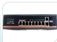
G0822GB € 327,00