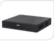
IP- NVR2116HS-I2 € 349,00