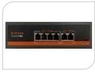
F0420FBL-C € 115,00

SWITCH 4 PORTE POE 10/100Mbps ATTIVO 4+2 2*RJ45 10/100Mbps