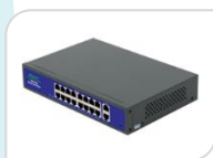
G1620GB € 380,00