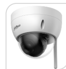
IPC- HDBW1430DE-SW € 220,00