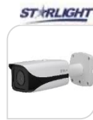
IPC- FHW5231EP-ZE € 480,00