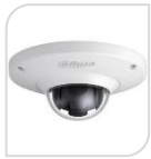
IP-SE- EB5400P € 380,00

MINI PT 2Mp * Full HD * 1/2.8" Sensore CMOS progressivo * Ottica fissa da 3.6mm * Digital Zoom 3X * MICROFONO * Risoluzione massima 2Mp con 25fps * Rotazione PAN 180° (0.1°~00°/s su preset) * TILT 0°~90° (0.1°~100°/s) * Luminosità 0.01lux f1.2 * Porta LAN 10/100Mbps * Privacy Mask 4 aree * 3D * D-WDR * Slot Micro SD-Card ( max64GB) * Eco Savvy * Alimentazione 12Vdc o PoE IEEE802.3af < 3W * CMS per PC/Mac (PSS/DSS) * App per iPhone e Android (iDMSS) * esterno/interno * IP66 * IK10 *DIMENSIONI: Ø130mmx57,5mm *PESO: Kg0.25