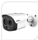
TPC-BF1241P-B7F8-DW-S2 € 1.640,00