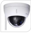
IPC- SD22204UE-GN-W € 396,00