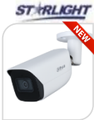
IPC- HFW3841E-S-2 € 470,00