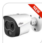
TPC-BF1241-B10F12-DW-WIFI-S8 € 1.850,00