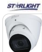
IPC- HDW3841TP-ZS-S2 € 710,00

8MP * CMOS 1 /2.7" * Ottica Motorizzata 2.7~13,5mm * STARLIGHT 0.008 lux@F1.5 * 2 Led 40m * SMART H.264+/H.265 * H.265 codec * ROI * WDR * 3D NR * HLC * BLC * IVS : Tripwire * Intrusion * Oggetto Abbandonato/Dimenticato * Motion detection * IP67 * IK10 * Slot Micro SD * 256G Alimentazione 12DC/PoE * Consumo <7.4W * METALLO ACCESSORI OPZIONALI: PFA137* PFB203W* PFA152-E*PFA200W*PFA106*PFB220C* PFB200C *DIMENSIONI: Φ122mmx88,9mm *PESO: kg 0,47