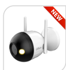
F4C-PV € 180,00

* DIMENSIONI: 131.0 mm x 78.4 mm x 97.2 mm * PESO: 254,5 g