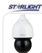
IPC- SD5A432GB-HNR € 2.120,00