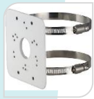
SE-PFA152-E € 34,00