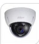
IP- SE-HDBW4800EP € 280,00

8MP * Eco-Savvy * Sensore d'immagine 1/2.3" 4K progressive scan CMOS * Ottica 4,0mm * Illuminatore IR max 30m * ULTRA HD 4K (3840x2160) * Max 15fps@4K(3840x2160) * Day/Night (ICR) * 3DNR * AWB * AGC * BLC * Protezione IP66 * IK10 * CMS per PC/Mac (PSS/DSS) * App per iPhone e Android (iDMSS) * Alimentazione 12V DC/PoE IEEE802.3af < 7.5W ACCESSORI OPZIONALI: PFA131 PFA123 PFB200W *DIMENSIONI: 110mmx81mm *PESO: Kg 0.406