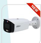
IPC-HFW3849T1-AS-PV-S4 € 596,00