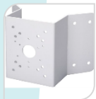
SE-PFA151 € 80,00

STAFFA DA PALO MATERIALE: SECC BIANCO DIMENSIONI: 130,4x170x45mm DIAMETRO: Ø80-150mm TEMPERATURA: <40°C+60°C UMIDITA': <90%RH PESO: Kg 1.1 CARICO: Kg 10