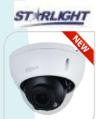
IPC- HDW71242E1-Z-X € 1.800,00