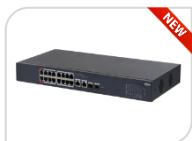
CS4218-16ET-190 € 568,00

Switch desktop gestito su cloud a 10 porte con 8 porte PoE Porte 1-4: 4 x RJ-45 10/100 Mbps (PoE); Porte 5-6: 2 x RJ-45 10/100/1000 Mbps (uplink) virtual Lan (VLAN) DC 53V 1.226 A Porta 1 ≤ 60 W, Porte 2-4 ≤ 30 W, totale ≤ 60 W max distanza 250mt *DIMENSIONI: 190 mm x 106 mm x 30 mm *PESO: 0.5 kg