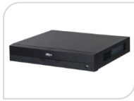
IP- NVR2216-16P-I2 € 858,00