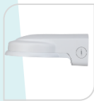
SE-PFB211W € 68,00

STAFFA PER MONTAGGIO A PARETE IN ALLUMINIO - BIANCO DIMENSIONI: 200x160x115mm PESO: kg 0.87 CARICO: Kg 5.0 TEMPERATURA -40°C +65°C UMIDITA' <90%RH