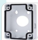
SE-PFA120 € 48,00