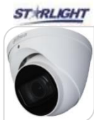
CVI-HAC- HDW2241TP-Z-A € 240,00

DOME IR 4 IN 1 STARLIGHT.2.0Mp 2,7-13,5mm MOTORIZZATA con autofocus automatico HDCVI/TVI/CVBS/AHD 2 IR led120Db WDR,3dnr-Max30fps@1080p –HD e SD switchable –Max IR 60mt, Smart IR - DC12V – 0.005lux/F1.3(0 lux IR on) – Day/Night – 2D/3D – ALLUMINIO – IP67 ACCESSORI OPZIONALI: PFA130-E - PFA137 - PFA152-E - PFB203W - PFM820 * DIMENSIONI 122x104.9x.4mm * PESO : Kg0.74