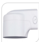
SE-PFB210W € 68,00

STAFFA PER MONTAGGIO A PARETE WATER-proof IN ALLUMINIO - BIANCO DIMENSIONI: 161.6 mm x 125.6 mm x 76.0 mm PESO: 0.49 kg CARICO: Kg 2,0 TEMPERATURA -40°C +60°C UMIDITA' <90%RH