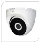
CVI-HAC-T2A51 NON DISPONIBILE