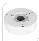
SE-PFA130-E NON DISPONIBILI

WATER-PROOF BOX DI GIUNZIONE MATERIALE: IN ALLUMINIO BIANCO PROTEZIONE: IP66 – DIMENSIONI: 134x33.5x56mm PESO: kg 0.54 CARICO: Kg 3 TEMPERATURA -40°C +60°C UMIDITA': <90% RH