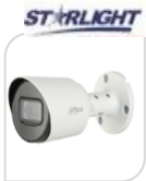
CVI-HAC- HFW1230TP € 99,00

IR BULLET 2.0 Mp - 4IN1 HDCVI/TVI/CVBS/AHD - 2.8mm - Max risoluzione 1080P frame 30fps@1080P 25/30/50/60fps@720P da esterno/interno IP67 - sensore CMOS progressivo 1/2.7" , luminosità 0.02Lux (0 con LED ON), 1 led IR portata fino a 20m, 2D, uscita video HD-CVI, alimentazione 12V-Digital WDR-AGC-2D NR- in dotazione staffa di fissaggio - IP67, MICROFONO - ALLUMINIO ACCESSORI OPZIONALI: PFA134 - PFA152-E (PFM820 telecomando per cambio tecnologia) *DIMENSIONI: 176x72.4x72.5mm *PESO: Kg 0.34