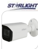
CVI-HAC- HFW2802T-A-I8 € 260,00

BULLET 4K 8 Mpx , trasmissione video in tempo reale , Commutabile CVI / CVBS / AHD / TVI , MICROFONO incorporato (-A) , Obiettivo fisso 2,8 mm , 2 IR LED , Distanza IR 40 m , Smart IR , IP67, 12V ± 30% DC. Materiale: METALLO+PLASTICA ACCESSORI OPZIONALI: PFA134 - PFA152-E - PFA12A * DIMENSIONI : 204,7mm×90,7mm×90,4mm (6.87"×2.78"×2.85") * PESO : 0.28Kg