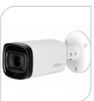
CVI-HAC- HFW1801RP-Z-A € 290,00