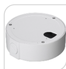
SE-PFA131 € 24,00

WATER-PROOF BOX DI GIUNZIONE – MATERIALE: IN ALLUMINIO & SECC - BIANCO PROTEZIONE: IP66 – DIMENSIONI: 90x36,1mm – PESO: kg 0.24 CARICO: 1Kg TEMPERATURA -40°C +60°C UMIDITA': <90% RH