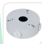
SE-PFA13G € 28,00

WATER-PROOF BOX DI GIUNZIONE - MATERIALE: IN ALLUMINIO & SECC – BIANCO DIMENSIONI: ø160mm x 41,5mm PESO: Kg 0,87 CARICO: 3 Kg TEMPERATURA -40°C +60°C UMIDITA': <90% RH