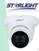
CVI-HAC-HDW2501TMQP-Z-A € 270,00

DOME 5MP HDCVI/TVI/CVBS/AHD, ottica MOTORIZZATA 2.7-13.5mm, I parametri e le schede tecniche visibili tramite QR (accanto) possono essere applicati solo alla serie 1500-S2, Max 25 fps@5MP (uscita video 16:9), MICROFONO INCORPORATO (-A), Massimo IR lunghezza 60 m, Smart IR > IP67, DC12V. ACCESSORI OPZIONALI: PFA13F - PFA152-E - PFB211W *DIMENSIONI: Ø135 mm × 109 mm *PESO: Kg 0,52