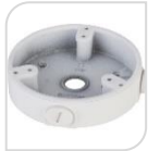
SE-PFA137 € 25,00

WATER-PROOF BOX DI GIUNZIONE – MATERIALE: IN ALLUMINIO - BIANCO DIMENSIONI: 110x33,5mm – PESO: kg 0.18 CARICO: 1Kg TEMPERATURA -40°C +60°C UMIDITA' <90% RH