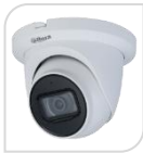
CVI-HAC-HDW1500TLMQ € 97,00

DOME IR 5MP-HD CVI/TVI/CVBS/AHD ottica 2.8mm, Per utilizzare la telecamera il firmware dell'XVR deve essere aggiornato a V4.001.0000001.0.R.200908 o versione successiva. Max 25 fps@5MP (uscita video 16:9), MICROFONO incorporato (-A), Massimo IR lunghezza 60 m, Smart IR, IP67, DC12V. METALLO + PLASTICA ACCESSORI OPZIONALI: PFA130-E, PFA152, PFA137 *DIMENSIONI: Ø121.9 mm × 99.1 mm (Ø4.8" × 3.9") *PESO: Kg 0,4