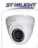
CVI-HAC-HDW1230MP-S4 € 80,00

DOME IR 2MP-HD CVI/TVI/CVBS/AHD ottica 2.8mm , Max 25 fps@5MP (uscita video 16:9), MICROFONO incorporato (-A) , Massimo IR lunghezza 60 m , Smart IR , IP67, DC12V - ALLUMINIO ACCESSORI OPZIONALI: PFA130-E, PFA137, PFB205W *DIMENSIONI: φ121.9 mm × 99.1 mm (φ4.8" × 3.9") *PESO: Kg 0,4