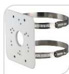
SE-PFA152-E € 34,00