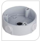
SE-PFA136 € 25,00

WATER-PROOF BOX DI GIUNZIONE – MATERIALE: IN ALLUMINIO - BIANCO DIMENSIONI: 90x34,1mm – PESO: kg 0.16 CARICO: 1Kg TEMPERATURA -40°C +60°C UMIDITA' <90% RH