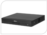
XVR5108HS-I3 NON DISPONIBILE