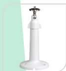
SE-PFB110W € 18,00

STAFFA PER MONTAGGIO A PARETE IN ALLUMINIO - BIANCO DIMENSIONI: 235.4 mm x 180.3 mm x 84.2 mm PESO: kg 0,97 CARICO: Kg 3 TEMPERATURA -40°C to +60°C UMIDITA' 0~90%RH