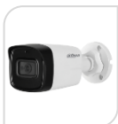
CVI-HAC- HFW1801TLP-A € 170,00

BULLET 4K –8 Mp - HDCVI/TVI/CVBS/AHD - LENTE 3.6mm -120dB - True WDR, 3DNR-risoluzione - MAX 4K – Max IR distanza 80m Smart IR – iP67 –2D/3D Day/Night -2 IR LED- DC12V Materiale: METALLO+PLASTICA ACCESSORI OPZIONALI: PFA130-E PFA152E * DIMENSIONI : 240.7x90.7x90.4mm * PESO : kg 0.410