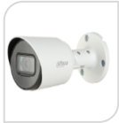
CVI-HAC- HFW1200TP € 80,00

IR BULLET 2,0 Mp HDCVI - obiettivo fisso da 3,6mm/2,8mm - Max. 30 fps @ 1080P - Uscita HD e SD commutabile - Obiettivo fisso da 3,6 mm (2,8 mm, 6 mm opzionale) - Max. Lunghezza IR 20 m, Smart IR - P67, DC12V - SERIE COPPER - luminosità 0.04Lux/F1.85, 30IRE, 0Lux IR on. - ALLUMINIO ACCESSORI OPZIONALI: PFA134 - PFA152-E *DIMENSIONI: 69.8mm×69.8mm×157.6mm *PESO: Kg 0,25