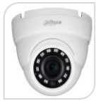
CVI-HAC- HDW1800M € 139,00