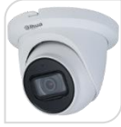
CVI-HAC-HDW1200TMQ-A € 95,00

DOME IR camera HDCVI - 4IN1 -HDCVI/TVI/CVBS/AHD 2.0Mp , ottica da 2.8mm da esterno/interno IP67 con sensore progressivo 1/2.8" CMOS, MICROFONO , risoluzione 1.080p con 25Fps o 720p con 25/50 Fps, ICR, luminosità 0.02Lux (0 con LED ON), led IR portata fino a 50mt, 2 D, uscita video HD-CVI o PAL, OSD su cavo coassiale, alimentazione 12Vdc <5W - ALLUMINIO ACCESSORI OPZIONALI: PFA139- PFA130E- PFB204W-PFB152 *DIMENSIONI: Ø106mm×93.7mm *PESO: Kg0.30