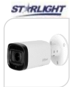
CVI-HAC- HFW1231RP-Z-A € 196,00

BULLET IR 2.0 Mp - 4 IN 1 HDCVI/HDTVI/AHD/CVBS- MOTORIZZATA con autofocus gestito manualmente dal dvr - 1080P IR 60m - risoluzione FULL HD, ottica varifocale 2.7/12mm e sensore 1/ 2.7" 2Mp - 0.02LUX- DC12V - illuminatore smart fino a 60m, 4 LED, Day/Night (ICR), OSD,AWB,AGC,DWDR. interno/esterno IP67- ALLUMINIO - MICROFONO ACCESSORI OPZIONALI: PFA130/E - PFA135 - PFA152/E -PFM820 *DIMENSIONI: 213x90.4x90.4mm *PESO: kg 0,55