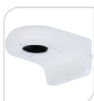
SE-PFB205W € 33,60

STAFFA PER MONTAGGIO A PARETE WATER-proof IN ALLUMINIO - BIANCO DIMENSIONI: 160x122x76mm PESO: kg 0.49 CARICO: Kg 1.0 TEMPERATURA -40°C +60°C UMIDITA' <90%RH