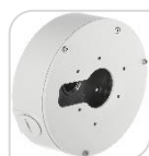
SE-PFA13F € 64,00

WATER-PROOF BOX DI GIUNZIONE – MATERIALE: IN ALLUMINIO & SECC - BIANCO DIMENSIONI: 138x42mm – PESO: kg 0.38 CARICO: 3Kg TEMPERATURA -40°C +60°C UMIDITA': <90% RH