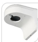
SE-PFB203W € 32,00