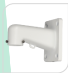
SE-PFB305W € 46,00

STAFFA PER MONTAGGIO A PARETE IN ALLUMINIO - BIANCO DIMENSIONI: 115x160x255mm PESO: kg 0.66 CARICO: Kg 7.0 TEMPERATURA -40°C +65°C UMIDITA' <90%RH