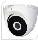
CVI-HAC-T2A21 € 71,00

DOME IR 4IN1 -HDCVI/TVI/CVBS/AHD 2.0Mp ottica 2,8 da interno con sensore progressivo 1/2.7" CMOS da, risoluzione 1.080p con 25Fps o 720p con 25/50 Fps, ICR meccanico, luminosità 0.04Lux (0 con LED ON), D-WDR, BLC-HLC , IR portata fino a 20mt, 2 D,uscita video HD o BNC, OSD su cavo coassiale, alimentazione 12Vdc -tecnologia switchabile da menu del dvr Dahua o con telecomando PFM820 - non in dotazione - PLASTICA ACCESSORI OPZIONALI: PFA13A - PFB204W - PFA152-E *DIMENSIONI Ø85,5mm×68mm *PESO Kg 0,09