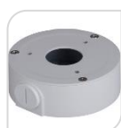
SE-PFA134 € 24,00

WATER-PROOF BOX DI GIUNZIONE MATERIALE: IN ALLUMINIO BIANCO PROTEZIONE: IP66 – DIMENSIONI: 124x41mm PESO: kg 0.35 CARICO: Kg 3 TEMPERATURA -40°C +60°C UMIDITA': <90% RH