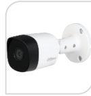
CVI-HAC- B2A21P € 72,00

IR BULLET 2,0 Mp HDCVI - obiettivo fisso da 3,6mm - Max. 30 fps @ 1080P - Uscita HD e SD commutabile - Max. Lunghezza IR 20 m, Smart IR - P67, DC12V - SERIE COPPER - luminosità 0.04Lux/F1.85, 30IRE, 0Lux IR on. - PLASTICA ACCESSORI OPZIONALI: PFA134 - PFA152-E *DIMENSIONI: 149.3 mm × 69.8 mm × 69.8 mm *PESO: Kg 0,14