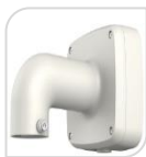
SE-PFB302S € 78,00

STAFFA PER MONTAGGIO A PARETE IN ALLUMINIO - BIANCO DIMENSIONI: 229,7x168,7x113,2mm PESO: kg 0.93 CARICO: Kg 3,0 TEMPERATURA -40°C +65°C UMIDITA' <90%RH