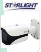
CVI-HAC- HFW3802EP-ZH € 640,00

BULLET 4K STARLIGHT – 8 Mp - HDCVI/TVI/CVBS/AHD - LENTE 3.7-11mm MOTORIZZATA 120dB True WDR,3DNR- risoluzione -MAX 4K – HD/SD switchable - 1 INGRESSO AUDIO - Max.IR 80mt Smart IR – iP67 –2D/3D – Day/Night -2 IR LED- AC24V/DC12V- ALLUMINIO ACCESSORI OPZIONALI: PFA130E – PFA122 - PFA152E PFA151 * DIMENSIONI : 244.1x90.4x90.4mm * PESO : kg 1.05