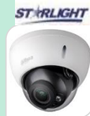
CVI-HAC-HDBW2501RP-Z € 250,00

DOME 5MP STARLIGHT - HDCVI/TVI/CVBS/AHD, ottica 2.7-13.5mm - MOTORIZZATA , CONTROLLO FOCUS AUTOMATICO - MICROFONO INCORPORATO - WDR 120dB True WDR, 3DNR 0.005Lux/F1.3, 0Lux IR on Max 4MP real-time, frame rate 20fps@5Mp, 25/30fps@4MP, 25/30fps@1080P, IR-2 IR LED, Max distanza 60m, Smart IR-IP67- ALLUMINIO ACCESSORI: PFA13F - PFB211W - PFA152-E *DIMENSIONI: Ø122mmx107mm *PESO: Kg 0.60