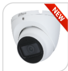
CVI-HAC-HDW1200TQ-A-S6 € 80,00

DOME IR 4IN1 -HDCVI/TVI/CVBS/AHD 2.0Mp ottica 2,8 da esterno/interno IP67 con sensore progressivo 1/2.7" CMOS da, risoluzione 1.080p con 25Fps o 720p con 25/50 Fps, ICR meccanico, luminosità 0.04Lux (0 con LED ON), D-WDR, BLC-HLC , IR portata fino a 20mt, 2 D,uscita video HD o BNC, OSD su cavo coassiale, alimentazione 12Vdc - ALLUMINIO ACCESSORI OPZIONALI: PFA13A - PFB204W - PFA152-E - tecnologia switchabile da menu del dvr Dahua o con telecomando PFM820 - non in dotazione *DIMENSIONI Ø94mm×78mm *PESO Kg 0,27