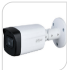
CVI-HAC- HFW1801THP-I8 € 186,00

BULLET 4K 8 Mpx , trasmissione video in tempo reale , Commutabile CVI / CVBS / AHD / TVI, MICROFONO incorporato (-A) , Obiettivo fisso 2,8 mm , 1 IR LED , Distanza IR 30 m , Smart IR , IP67, 12V ± 30% DC. Materiale: METALLO ACCESSORI OPZIONALI: PFA134* PFA152-E * DIMENSIONI : 174.5mm×70.6mm×72.3mm (6.87"×2.78"×2.85") * PESO : 0.35Kg