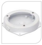
SE-PFA132 € 40,00