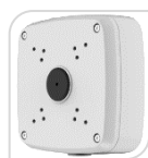
SE-PFA121 € 46,00