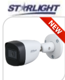
CVI-HAC- HFW1231CM € 96,00

IR BULLET 2.0 Mp - STARLIGHT - 4IN1 HDCVI/TVI/CVBS/AHD - obiettivo fisso 3.6mm - Max risoluzione 1080P frame 30fps@1080P 25/30/50/60fps@720P da esterno/interno IP67 - sensore CMOS progressivo 1/2.7" ; luminosità 0.005Lux (0 con LED ON), 1 led IR portata fino a 20m, 2D, uscita video HD-CVI, alimentazione 12V-Digital WDR-AGC-2D NR- in dotazione staffa di fissaggio - IP67- ALLUMINIO ACCESSORI OPZIONALI: PFA134 - PFA152-E - (PFM820 telecomando per cambio tecnologia) *DIMENSIONI: 176x72.4x72.5mm *PESO: Kg 0.34