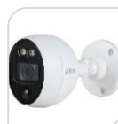
CVI-HAC- ME1500B-LED € 95,00

IR bullet HDCVI MotionEye IoT da interno/esterno IP67, Deterrenza attiva con Luce Bianca Allarme preciso via PIR & Motion Dual-detection, sensore CMOS, CMOS progressivo 1/2.7", ICR auto , DWDR, 2D, AGC, risoluzione a 1080p a 25fps, ottica fissa 2.8 mm, portata LED IR fino a 20 m, OSD, PIR 10 m e 110°, alimentazione 12 Vdc ACCESSORI: PFA134 , PFA152-E *DIMENSIONI: 46.6mmx72.4mmx83mm *PESO: kg. 0.30