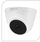
CVI-HAC-T1A21 € 55,00