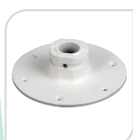
SE-PFA108 € 24,00

ADATTATORE IN ALLUMINIO – BIANCO DIMENSIONI: \Phi 134.1mmx83.5mm PESO: 0.29kg CARICO: Kg 1 TEMPERATURA: -40°C ~+ 60°C UMIDITA': <90%RH ADATTO AI MODELLI: PFB305W – PFB220C