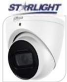
CVI-HAC- HDW2802TP-Z-A € 366,00

DOME 4K 8MP STARLIGHT HDCVI/TVI/CVBS/AHD LENTE 3.7-11mm - MOTORIZZATA - 120dB True WDR,3DNR- risoluzione -MAX 4K - HD/SD switchable-1 ingresso AUDIO- Max IR distanza 30m - Smart IR - IP67 -2D/3D - Day/Night -2 IR LED - DC12V-- ALLUMINIO ACCESSORI: PFA137 PFB200C PFB203W PFA152-E PFA106 PFB220C PFA200W *DIMENSIONI : 122x88.9mm *PESO: kg 0.65