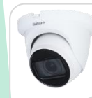
CVI-HAC-HDW1500TMQP-Z-A € 202,00