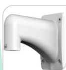
SE-PFB303W € 48,00

STAFFA PER MONTAGGIO A PARETE IP66 IN ALLUMINIO - BIANCO DIMENSIONI: 134x133,5x187,5mm PESO: kg 7 CARICO: Kg 4 PROTEZIONE IP66 TEMPERATURA -40°C +65°C UMIDITA' 0~90%RH