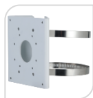
SE-PFA156 € 42,00

STAFFA DA ANGOLO MATERIALE: SECC BIANCO DIMENSIONI: 243x170x138mm TEMPERATURA:<40°C+60°C UMIDITA':<90%RH PESO: Kg 1.7 CARICO: Kg 10