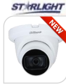
CVI-HAC- HDW1231TMQ-Z-A € 190,00

DOME IR HDCVI da 2 MP , ottica 2,7~12mm MOTORIZZATA con autofocus gestito manualmente dal dvr, I parametri e le schede tecniche di seguito possono essere applicati solo alla serie 1200-S5 , Massimo 30fps@1080P, CVI/CVBS/AHD/TVI commutabile , MICROFONO (-A) , Massimo IR lunghezza 60 m, Smart IR , IP67, DC12VC - METALLO/PLASTICA . ACCESSORI OPZIONALI: PFA13F – PFA152-E – PFB211W * DIMENSIONI : \Phi 135 mm×109 mm * PESO : Kg 0,52