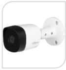
CVI-HAC- B1A21P € 55,00