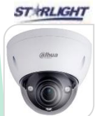
CVI-HAC- HDBW3802EP-ZH € 640,00

DOME 4K 8MP STARLIGHT HDCVI/TVI/CVBS/AHD LENTE 3.7-11mm - MOTORIZZATA- 120dB True WDR,3DNR- risoluzione -MAX 4K - HD/SD switchable-1 ingresso AUDIO e MICROFONO - Max IR distanza 60m - Smart IR - IP67 -2D/3D - Day/Night -2 IR LED- DC12V- ALLUMINIO ACCESSORI: PFA130-E PFA152E PFB203W *DIMENSIONI : 122x107mm *PESO: kg 0.59