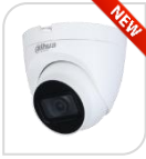
CVI-HAC-HDW1500TRQ-S2 € 82,00

DOME IR 4IN1 -HDCVI/TVI/CVBS/AHD 5 Mp ottica 2,8 da esterno/interno IP67 con sensore progressivo 1/2.7" CMOS da, risoluzione 1.080p con 25Fps o 720p con 25/50 Fps, ICR meccanico, luminosità 0.04Lux (0 con LED ON), D-WDR, BLC-HLC, IR portata fino a 20mt, 2 D, uscita video HD o BNC, OSD su cavo coassiale, alimentazione 12Vdc - ALLUMINIO ACCESSORI OPZIONALI: PFA13A - PFB204W - PFA152-E - tecnologia switchabile da menù del dvr Dahua e con telecomando PFM820 - non in dotazione *DIMENSIONI Ø94mm×78mm *PESO Kg 0,27