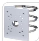
SE-PFA150 € 76,00

STAFFA DA PALO MATERIALE: ALLUMINIO DIMENSIONI: 125,6X114X20 DIAMETRO PALO: 80-150mm TEMPERATURA: <40°C+60°C UMIDITA': <90% RH PESO: Kg 0,27 CARICO: Kg 3