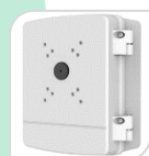
SE-PFA140 € 300,00

WATER-PROOF BOX DI GIUNZIONE – MATERIALE: IN ALLUMINIO - BIANCO DIMENSIONI: 115x160x37 mm PESO: kg 0.53 CARICO: 7Kg TEMPERATURA -40°C +60°C UMIDITA' <90%RH