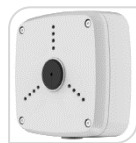
SE-PFA122 € 46,00

WATER-PROOF BOX DI GIUNZIONE MATERIALE: ALLUMINIO BIANCO- PROTEZIONE: IP66 DIMENSIONI: 134x133.5x56mm PESO: kg 0.54 CARICO: Kg 3 TEMPERATURA -40°C +60°C UMIDITA': <90% RH