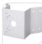
SE-PFA151 € 80,00

STAFFA DA PALO MATERIALE: SECC BIANCO DIMENSIONI: 130,4x170x45mm DIAMETRO PALO: Ø80-150mm TEMPERATURA:<40°C+60°C UMIDITA':<90%RH PESO: Kg 1.1 CARICO: Kg 10