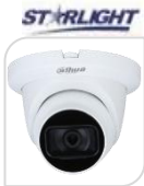
CVI-HAC-HDW2501TMQP-A € 186,00

DOME IR 5MP HD CVI/TVI/CVBS/AHD ottica 2,8mm, Max 25 fps @ 5 MP (uscita video 16:9), Massima Lunghezza IR 30m, Smart IR, IP67, 12V CC, MATERIALE: METALLO + PLASTICA ACCESSORI OPZIONALI: PFA13G - PFB205W - PFA130-E - PFA152-E. *DIMENSIONI: Ø109.9 mm × 88.1 mm *PESO: 0.33 kg