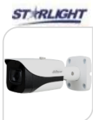
CVI-HAC- HFW2802EP-A € 218,00

BULLET 4K STARLIGHT –8 Mp - HDCVI/TVI/CVBS/AHD - LENTE 3.6mm -120dB - True WDR, 3DNR-risoluzione - MAX 4K – HD/SD switchable-1 ingresso AUDIO- Max IR distanza 80m Smart IR – iP67 –2D/3D Day/Night -4 IR LED- AC24V/DC12V Materiale: ALLUMINIO ACCESSORI OPZIONALI: PFA122- PFA130-E PFA152E PFA151 * DIMENSIONI : 244x79x75.9(90.A)mm * PESO : kg 0.53