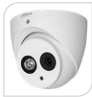
CVI-HAC-HDW1200EM-A-S6 NON DISPONIBILE

DOME IR camera HDCVI - 4IN1 -HDCVI/TVI/CVBS/AHD 2.0Mp , ottica da 2.8mm da esterno/interno IP67 con sensore progressivo 1/2.8" CMOS da, risoluzione 1.080p con 25Fps o 720p con 25/50 Fps, ICR, luminosità 0.02Lux (0 con LED ON), led IR portata fino a 50mt, 2 D, uscita video HD-CVI o PAL, OSD su cavo coassiale, alimentazione 12Vdc <5W - ALLUMINIO ACCESSORI OPZIONALI: PFA139- PFA130E- PFB204W-PFB152 *DIMENSIONI: Ø106mm×93.7mm *PESO: Kg0.30