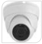
4/1 SE-MID-24-4MPA € 70,00

BULLET IR 4.0Mega Pixel (2500*1600p) - sensor FH8538M+GC4603) - uscita HDCVI/TVI/AHD/CVBS 4 Megapixel - Obiettivo fisso 3,6mm - LED 36 - Distanza IR 25m Day/Night con filtro meccanico - IP66 in Case Metallico - DC12V *DIMENSIONI 170L x 66 x 66 mm