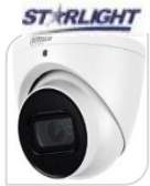
CVI-HAC- HDW2802TP-A € 216,00

DOME 4K 8 MP HDCVI/TVI/CVBS/AHD LENTE 2,8mm - 120dB True WDR,3DNR- risoluzione Max 4K - HD/SD switchable - Max IR distanza 30m - Smart IR - IP67 -2D/3D - Day/Night - 12 IR LED- DC12V- ALLUMINIO ACCESSORI PFA13-A - PFA152E - PFB204W *DIMENSIONI : 93.4x79.4mm *PESO: kg 0.3