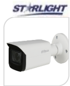
CVI-HAC- HFW2241TU-Z-A € 250,00

BULLET IR 2MP HDCVI MOTORIZZATA , Massimo 30 fps@1080P, Starlight , 130dB true WDR, 3D NR, Messa a fuoco automatica, obiettivo motorizzato da 2,7 mm a 12 mm > CVI/CVBS/AHD/TVI commutabile, Super Adatta ,, Massimo IR lunghezza 80 m, Smart IR ,, IP67, 12V CC. MICROFONO - ALLUMINIO ACCESSORI OPZIONALI: PFA13G - PFA130-E - PFA152-E *DIMENSIONI: 209.6 mm x 90.4 mm x 90.4 mm *PESO: Kg 0,55