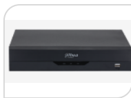
XVR5116HS-I3 € 540,00