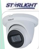
CVI-HAC-HDW1231TMQP-A € 110,00

DOME IR 4IN1 STARLIGHT -HDCVI/TVI/CVBS/AHD 2.0Mp ottica 3.6mm da esterno/interno IP67 con sensore progressivo 1/2.8" CMOS da, risoluzione 1.080p con 25Fps o 720p con 25/50 Fps, ICR meccanico, luminosità 0.005Lux (0 con LED ON), D-WDR, BLC-HLC , 12led IR portata fino a 30mt, 2 D,uscita video HD o BNC, OSD su cavo coassiale, alimentazione 12Vdc <5W - ALLUMINIO tecnologia switchabile da menu del dvr Dahua o con telecomando PFM820 - non in dotazione ACCESSORI OPZIONALI: PFA13A-E - PFA130/E - PFB204W - PFA152-E *DIMENSIONI: Ø93.4mm×79.7mm *PESO: Kg 0,27