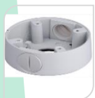
SE-PFA13C € 25,00

WATER-PROOF BOX DI GIUNZIONE – MATERIALE: IN ALLUMINIO - BIANCO DIMENSIONI: 96,8x37,2mm – PESO: kg 0.17 CARICO: 1Kg TEMPERATURA -40°C +60°C UMIDITA' <90%RH