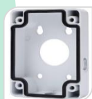
SE-PFA120 € 48,00