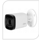
CVI-HAC- HFW1200RP-Z-IRE6-A € 180,00

BULLET IR 2.0 Mp - 4 IN 1 HDCVI/HDTVI/AHD/CVBS- MOTORIZZATA con autofocus gestito manualmente dal dvr - 1080P IR 60m - risoluzione FULL HD, ottica varifocale 2.7/12mm e sensore 1/ 2.7" 2Mp - 0.02LUX- DC12V - illuminatore smart fino a 60m, 4 LED, Day/Night (ICR), OSD,AWB,AGC,DWDR. interno/esterno IP67- ALLUMINIO ACCESSORI OPZIONALI: PFA130/E - PFA135 - PFA152/E -PFM820 *DIMENSIONI: 213x90.4x90.4mm *PESO: kg 0,55