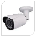
4/1 SE-25B4MPA € 70,00

BULLET IR 4.0Mega Pixel (2500*1600p) - sensor FH8538M+GC4603) - uscita HDCVI/TVI/AHD/CVBS 4 Megapixel - Obiettivo fisso 3,6mm - LED 36 - Distanza IR 25m Day/Night con filtro meccanico - IP66 in Case Metallico - DC12V *DIMENSIONI 170L x 66 x 66 mm