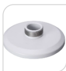
SE-PFA101 € 20,00

ADATTATORE MATERIALE: IN ALLUMINIO - BIANCO DIMENSIONI: 150,8x37mm PESO: kg 0.21 CARICO: Kg 3.0 TEMPERATURA: -40°C +60°C UMIDITA' <90%RH