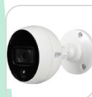
CVI-HAC- ME2802B € 196,00