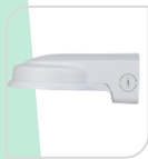
SE-PFB211W € 68,00

STAFFA PER MONTAGGIO A PARETE IN ALLUMINIO - BIANCO DIMENSIONI: 200x160x115mm PESO: kg 0.87 CARICO: Kg 5.0 TEMPERATURA -40°C +65°C UMIDITA' <90%RH