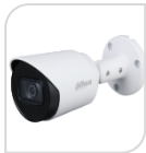
CVI-HAC- HFW1200TP-A € 86,00

IR BULLET 2.0 Mp - 4IN1 HDCVI/TVI/CVBS/AHD - 2.8 o 3.6mm - Max risoluzione 1080P frame 30fps@1080P 25/30/50/60fps@720P da esterno/interno IP67 - sensore CMOS progressivo 1/2.7" ; luminosità 0.02Lux (0 con LED ON), 1 led IR portata fino a 20m, 2D, uscita video HD-CVI, alimentazione 12V-Digital WDR-AGC-2D NR- in dotazione staffa di fissaggio - IP67- ACCESSORI PFA134 - PFA152-E (PFM820 telecomando per cambio tecnologia)- ALLUMINIO *DIMENSIONI: 176x72.4x72.5mm *PESO: Kg 0.34