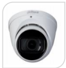
CVI-HAC- HDW1801TP-Z-A NON DISPONIBILE