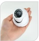
4/1 SE-MD500MA-2,8mm € 95,00

DOME IR 5MP - CVI/TVI/CVBS/AHD Starlight da interno/esterno IP67, sensore CMOS progressivo, risoluzione 5 MP (formato video 16:9), ICR, ottica fissa 2.8 mm, portata IR fino a 60 m, 1 ingresso audio con MICROFONO integrato, OSD, alimentazione 12 Vdc ACCESSORI OPZIONALI: PFA137/PFA130-E/PFB205W/PFA152-E *DIMENSIONE Ø122x99 mm *PESO 430GR