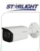
CVI-HAC- HFW2241T-I8 € 160,00

IR BULLET 2.0 Mp , Massima risoluzione 30 fps@1080P, STARLIGHT, 130 dB true WDR, 3D NR, Obiettivo fisso da 2,8 mm , CVI/CVBS/AHD/TVI commutabile, luminosità 0.002 Lux/F1.6, 30 IRE, 0 Lux IR on , Lunghezza max. IR 30 m, numero illuminatori 2, Smart IR, IP67, DC12V. ALLUMINIO ACCESSORI OPZIONALI: PFA134 - PFA130-E- PFA152-E *DIMENSIONI: 166.6 mm × 69.7 mm × 70.0 mm *PESO: 0.33 kg