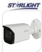
CVI-HAC- HFW2241TP-Z-A-VP-062 € 280,00

BULLET IR 2.0 Mp - 4 IN 1 HDCVI/HDTVI/AHD/CVBS - MOTORIZZATA con autofocus automatico - ottica varifocale 2,7-13,5mm- STARLIGHT - 4 IR led - 120dB - true WDR, 3dnr-Max30fps@1080p - HD e SD switchable - Max IR 80m , Smart IR- IP67-DC12V - 1 ingresso audio + MICROFONO 0.004lux/F1.6(0 lux IR on) - Day/Night - 2D/3D- ALLUMINIO ACCESSORI OPZIONALI: PFA130-E- PFA152-E *DIMENSIONI: 244.1x90.4x90.4mm *PESO: Kg 0,74