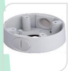
SE-PFA13A-E € 25,00

BOX DI GIUNZIONE A PARETE RESISTENTE ALL'ACQUA MATERIALE: IN PLASTICA RESISTENTE AGLI AGENTI ATMOSFERICI- BIANCO DIMENSIONI: 210,9x97,5x35mm PESO: kg 0.10 CARICO: Kg 0.300 TEMPERATURA -40°C +60°C UMIDITA' <90%RH