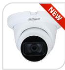
CVI-HAC- HDW1200TMQ-Z-A € 164,00