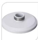
SE-PFA102 € 20,00

ADATTATORE IN ALLUMINIO – BIANCO DIMENSIONI: \Phi 159mmx35mm ( \Phi 6.26"x1.38") PESO: Kg 0,24 CARICO: Kg 3.0 TEMPERATURA: -40°C ~+ 60°C UMIDITA': <90%RH