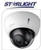
CVI-HAC- HDBW2802RP-Z € 329,00

DOME 4K 8 MP - HDCVI/TVI/CVBS/AHD LENTE 2.7-13.5mm - MOTORIZZATA- 120dB WDR, BLC/HLC/ 2D&3DNR- risoluzione -MAX 4K - HD/SD switchable- Max IR distanza 60m - Smart IR - IP67 - Day/Night -2 IR LED- DC12V- ALLUMINIO - MICROFONO ACCESSORI: PFA130-E PFA152E PFB203W *DIMENSIONI : 122x104.8mm *PESO: kg 0.59