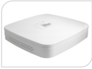
XVR4104C-I € 180,00