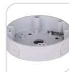
SE-PFA138 € 34,00

WATER-PROOF BOX DI GIUNZIONE – MATERIALE: IN ALLUMINIO - BIANCO DIMENSIONI: 122x34,2mm – PESO: kg 0.24 CARICO: 1Kg TEMPERATURA -40°C +60°C UMIDITA' <90% RH