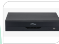
XVR5232AN-I3 € 1.180,00