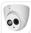
CVI-HAC-HDW1200EM-S5 € 84,00

DOME IR 2MP HD CVI/TVI/CVBS/AHD ottica 2,8mm , Max 30 fps @ (uscita video 16:9), Massima Lunghezza IR 40m, MICROFONO , Smart IR, IP67, 12V VDC, MATERIALE: METALLO + PLASTICA ACCESSORI OPZIONALI: PFA13G - PFB205W-E - PFA130-E - PFA152-E. *DIMENSIONI: φ109.9 mm × 88.1 mm *PESO: 0.33 kg