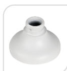
SE-PFA106 € 25,00

ADATTATORE IN ALLUMINIO – BIANCO DIMENSIONI: \Phi 133mmx37mm ( \Phi 5.23"x1.46") PESO: Kg 0,23 CARICO: Kg 0,13 TEMPERATURA: -40°C ~+ 60°C UMIDITA': <90%RH ADATTO AI MODELLI: PFB300C/ PFB302S