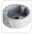
SE-PFA135 € 25,00

WATER-PROOF BOX DI GIUNZIONE – MATERIALE: IN ALLUMINIO - BIANCO DIMENSIONI: 155x155x39mm PESO: kg 0.47 CARICO: 3Kg TEMPERATURA -40°C +60°C UMIDITA' <90%RH