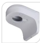
SE-PFB204W € 32,00

STAFFA PER MONTAGGIO A PARETE WATER-proof IN ALLUMINIO - BIANCO DIMENSIONI: 160x122x76mm PESO: kg 0.57 CARICO: Kg 1.0 TEMPERATURA -40°C +60°C UMIDITA' <90%RH