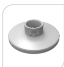
SE-PFA103 € 20,00

ADATTATORE IN ALLUMINIO – BIANCO DIMENSIONI: \Phi 169mmx37mm PESO: Kg 0,25 CARICO: Kg 3.0 TEMPERATURA: -40°C ~+ 60°C UMIDITA': <90%RH