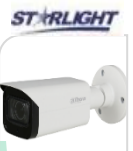
CVI-HAC- HFW2802TP-Z-A € 380,00

BULLET 4K –8 Mp - HDCVI/TVI/CVBS/AHD - LENTE 2.7-13.5mm MOTORIZZATA AUTOFOCUS ,120dB WDR 3DNR- risoluzione -MAX 4K – HD/SD switchable- Max.IR 60mt Smart IR – IP67 –2D/3D – Day/Night - 4 IR LED- DC12V- - MICROFONO integrato - ALLUMINIO ACCESSORI OPZIONALI: PFA130-E – PFA135 - PFA152E PFA151 * DIMENSIONI : 209.9x90.4x90.4mm * PESO : kg 0.55