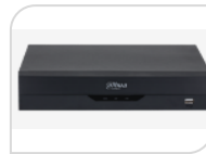
XVR5232AN-S2 € 960,00