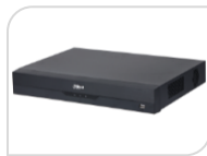
XVR5216AN-I3 € 720,00