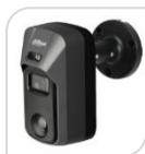
CVI-HAC- ME2241CP € 198,00

Telecamera HDCVI da esterno/interno IP67 Deterrenza attiva con Luce Bianca e Sirena , Allarme preciso via PIR & Motion Dual-detection; sensore CMOS progressivo 1/2.8", risoluzione 1080p con 25/30Fps, ICR auto, ottica fissa 2.8mm f1.6, luminosità 0.004Lux f1.6 (0 con Led ON), tecnologia Starlight, portata Led IR fino a 20mt, 1 ingresso audio con MICROFONO incorporato, 2D e 3D, WDR (120db), PIR 15mt, 110°, protocollo wireless Airfly, 12Vdc <5.5W ACCESSORI: PFA134 , PFA152-E *DIMENSIONI: 144.7x76,7x146,4mm *PESO: kg. 0.41